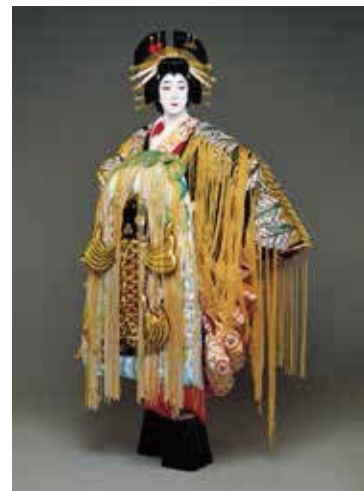
坂東五三郎 「助六由縁江戸桜」揚巻 1988年