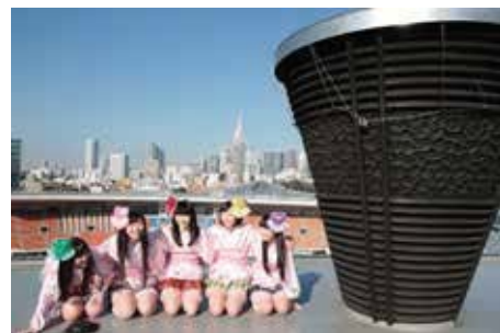
ももいろクローバーZ 2014年