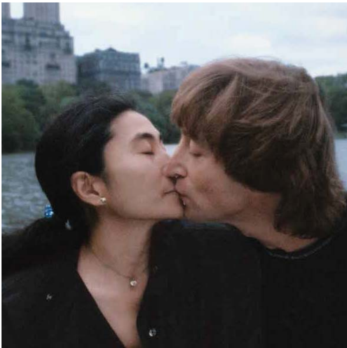
ジョン・レノン オノ・ヨーコ 1980年

2015年11月1日 [日] - 2016年1月11日 [月・祝] 高知県立美術館