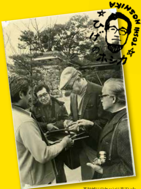
高知城にロケハンに来ていた 黒澤明監督とのひとコマ!