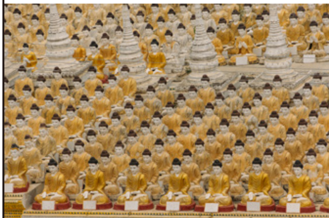
《レイチュン・セチャー大仏/ミャンマー》2011年