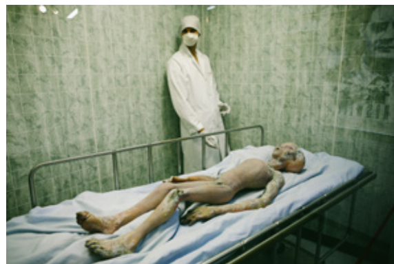
《ロズウェル/アメリカ》2006年