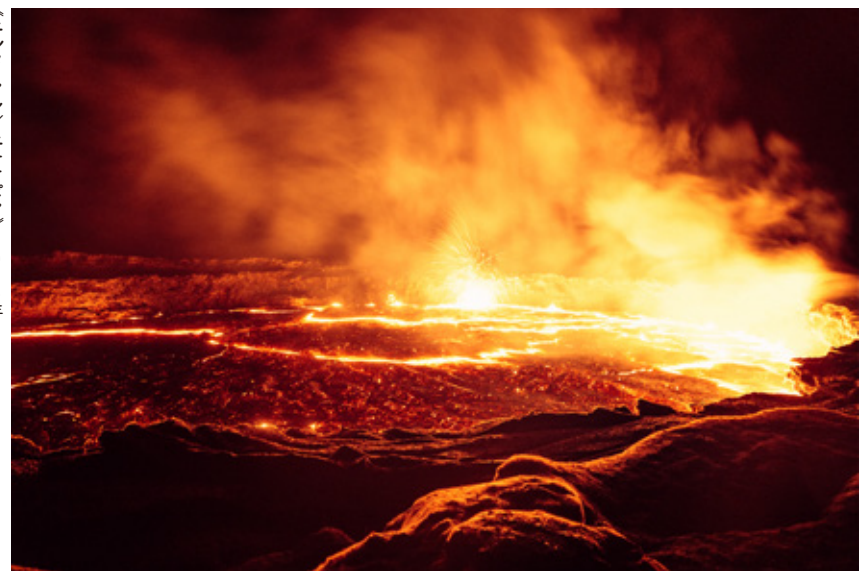
《エルタ・アレ/エチオピア》2015年