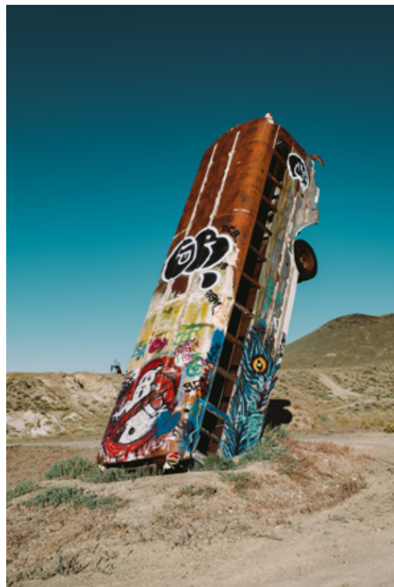
《Nevada, United States》2019年