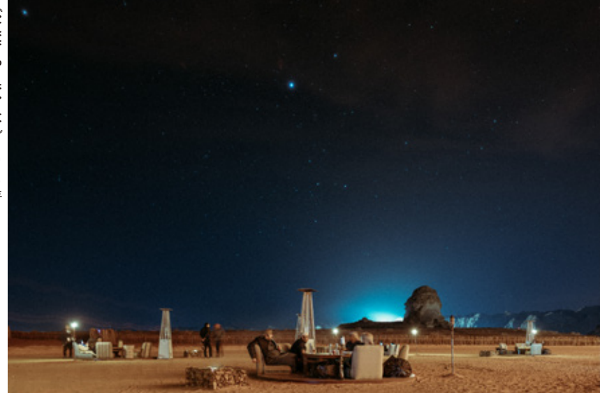
《Al-Ula, Saudi Arabia》2009年