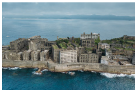
《精霊島(端島)/日本》2017年