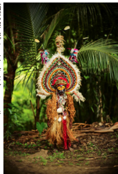
《精霊の家/パプア・ニューギニア》2014年