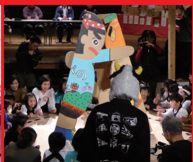
とんどこ! 巨大紙相撲観戦場所(2018)

同時開催 横浜美術館コレクション 王様の美術館 フランス近代美術とシュルレアリスムの精華 6月23日(土)~9月24日(月・祝) 観覧料:一般当日1,100円(880円) 大学生当日800円(640円) 高校生以下無料 *0)内は20名以上の団体割引料全 *年間観覧券所持者は無料 *身体障害者手帳、療育手帳、精神障害者保険福祉手帳、戦傷病者手帳及び被爆者健康手帳所持者とその介護者(1名)、高知県及び高知市長寿手帳所持者は無料