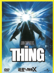
『遊星からの物体X』