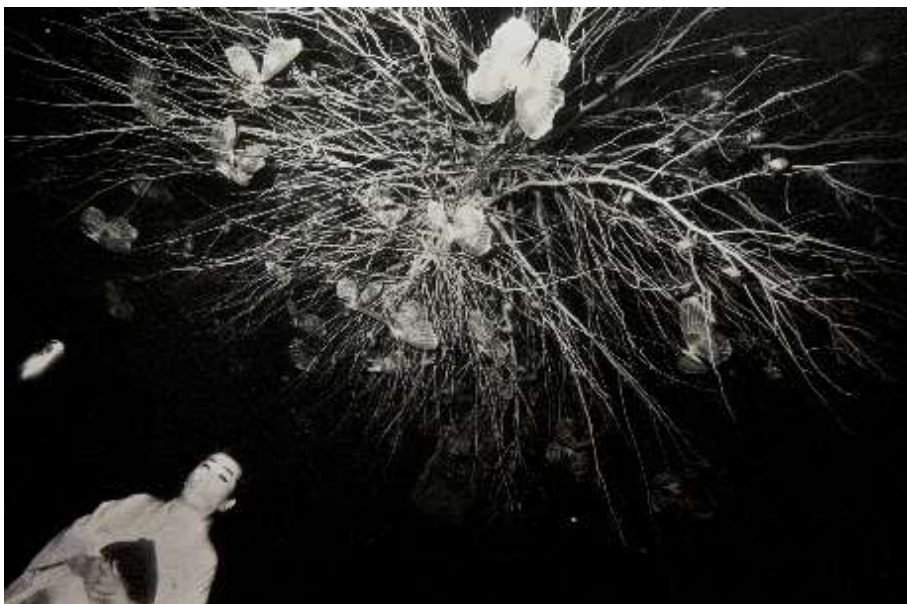
〈土佐深夜日記〉より 1984-90年頃