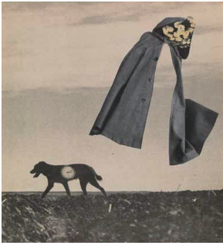
《はるかな旅》1953年 © Okanoue Toshiko, A Long Journey 高知県立美術館所蔵