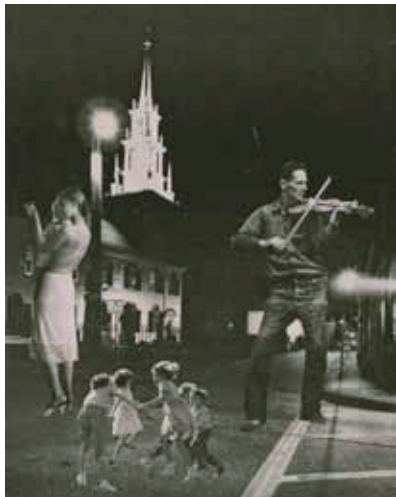
《夜の家族》1955年 © Okanoue Toshiko, Family at Night 高知県立美術館所蔵